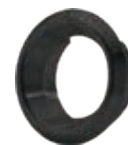
725-21-ZR Rosettenring, Schwarzstahl-Optik