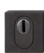
725-21-KVQ Sicherheitsrosette mit Ziehschutz, Schwarzstahl-Optik