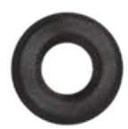
725-21-ZRS Kleberosette, Schwarzstahl-Optik